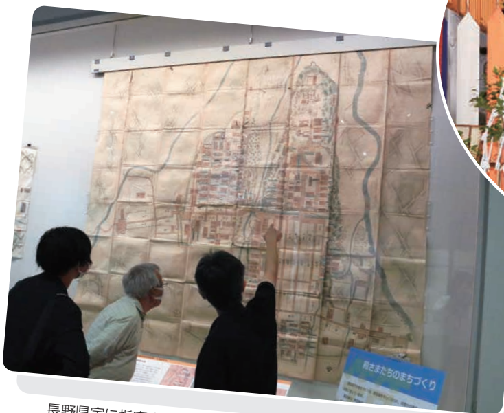
長野県宝に指定された迫力ある「飯田城絵図」