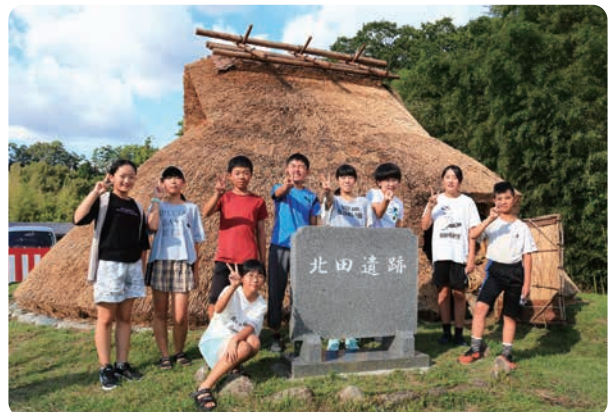
記念碑の除幕をした上久堅小学校6年生の皆さん

上久堅地区の皆さんが管理する北田遺跡公園では9月10日、改修した縄文時代の家屋が披露されました。この家屋は中に入ることができ、約4,500年前の暮らしぶりを思い浮かべることができます。