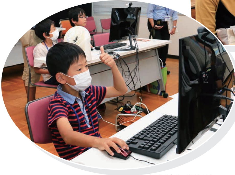
人工知能(AI)の世界を体験