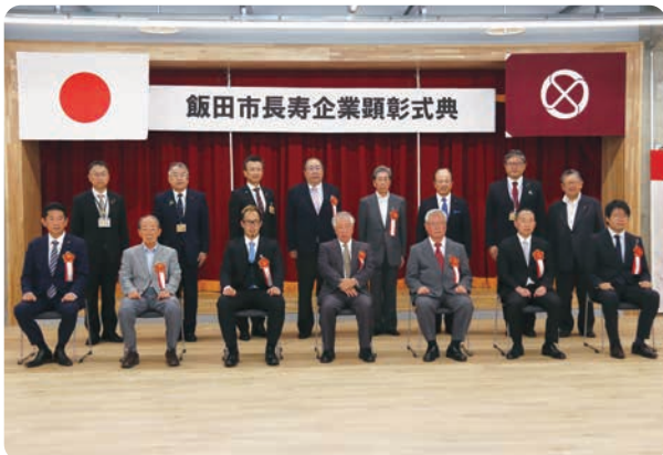
顕彰式典に参加された皆さん

市では、地域経済のさらなる発展に向け、長年にわたって事業を続ける市内の企業や団体などを顕彰しています。今年度は創業40~150年の10社をたえ9月30日、ムトスぶらざで表彰しました。