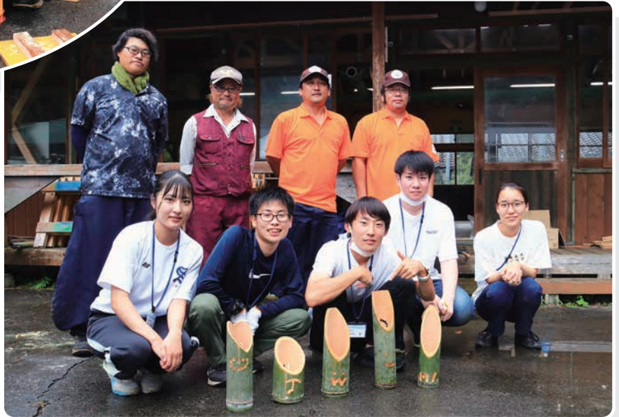
上村のどんぐり隊(後列)の皆さんと

フィールドワークでは4グループ(観光産業、ジオツーリズム、下栗と暮らし、子育て環境)に分かれ、地域の皆さんと活動しながら、地域資源の価値や活用方法を現地で学びました。